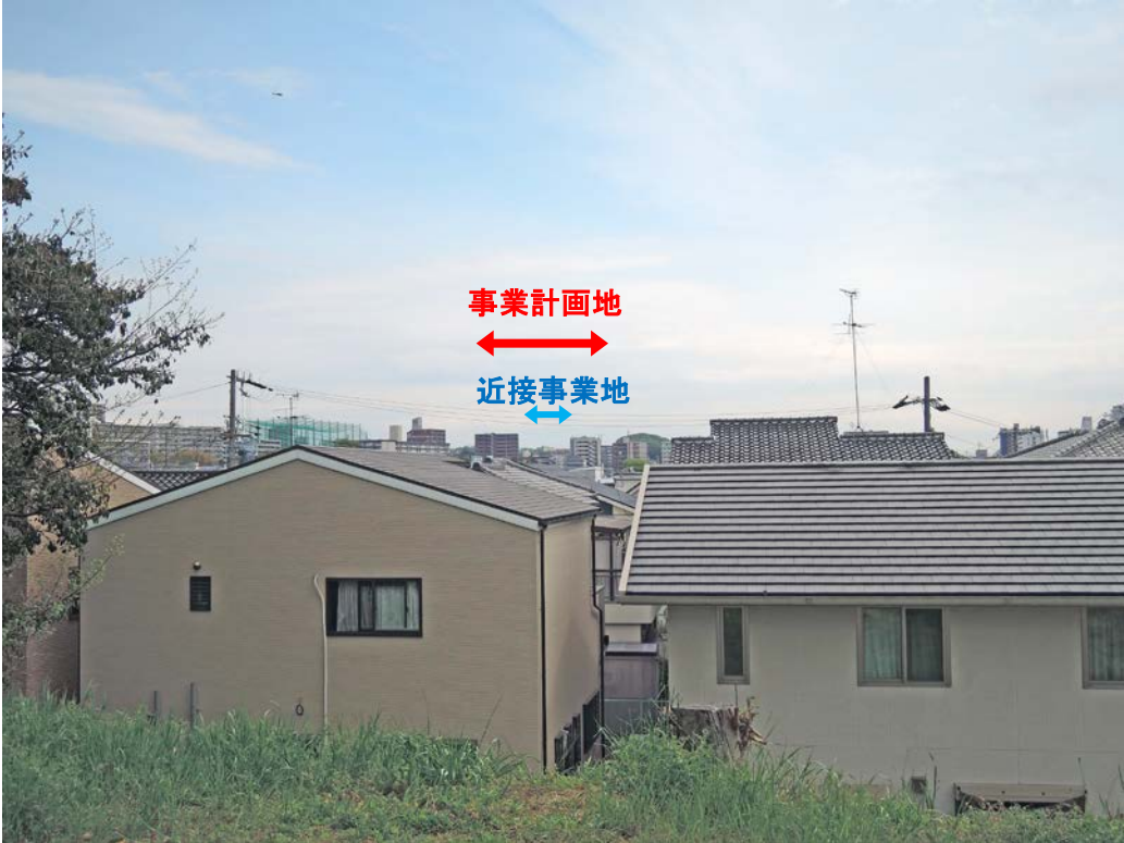
図 12. 14-2 (3) 景観の変化の程度 (⑥高川沿い遊歩道)