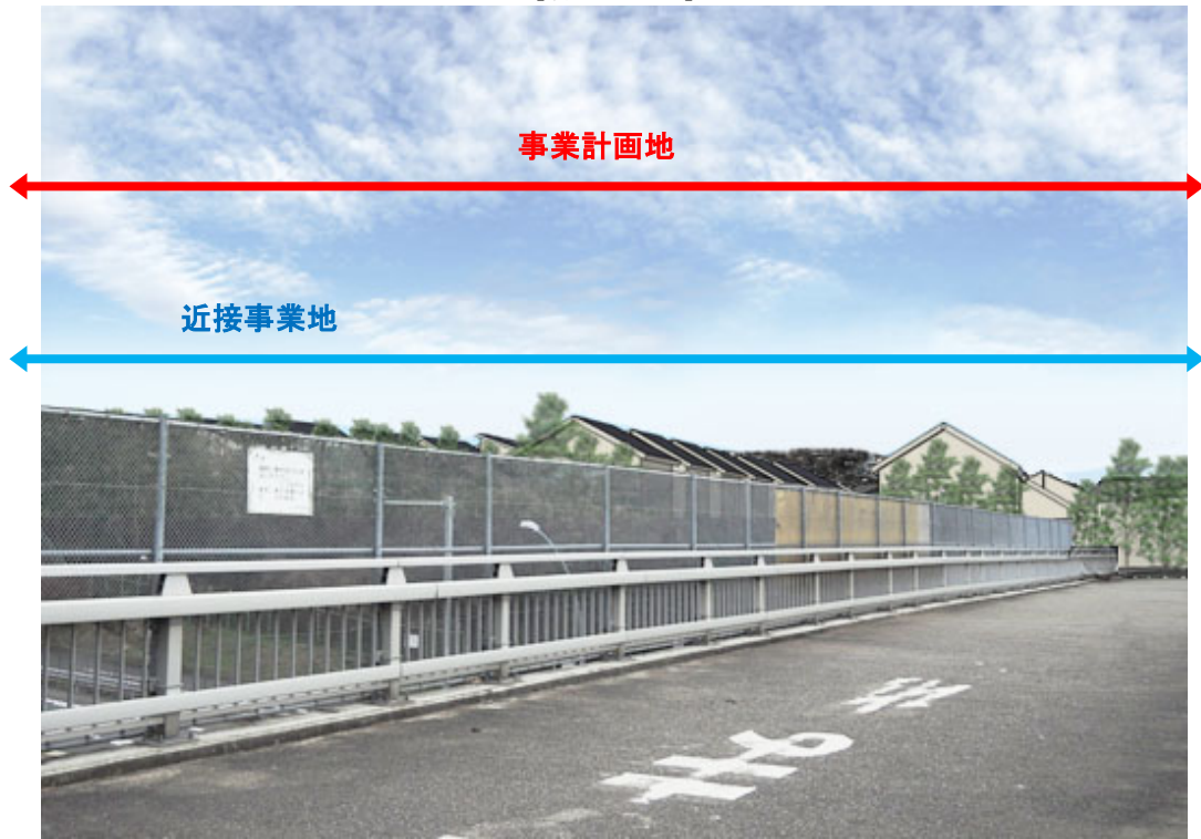
図 12.14-2(1) 景観の変化の程度 (①垂水西橋)